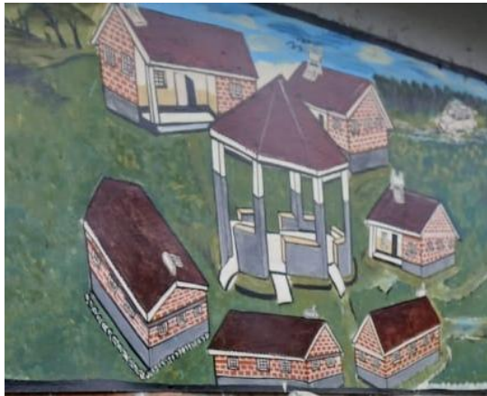
Village d'Enfants Mbingu

Chers amis du Village d'Enfants, voici le dernier rapport Mbingu de l'année, accompagné de nos meilleurs vœux pour la nouvelle année