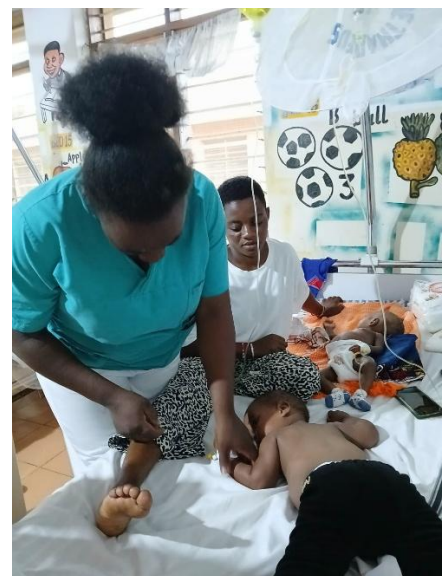
Valentino und Hosea