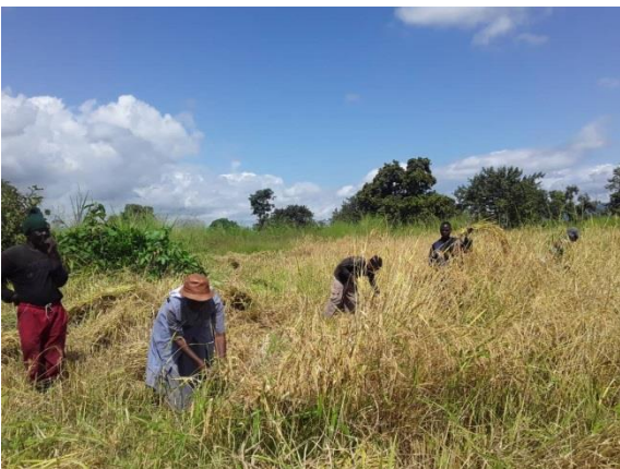
Ernte von Soya und Erdnuss