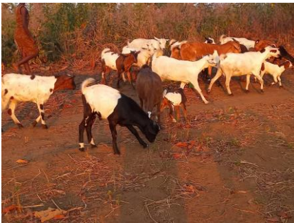
Aus 5 Ziegen wurden 24