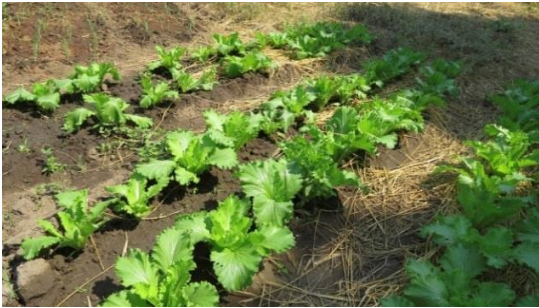
Salat und Gemüse

Ausbau und Stärkung der Nahrungsmittelproduktion auf Pflanzungen im Jahr 2022