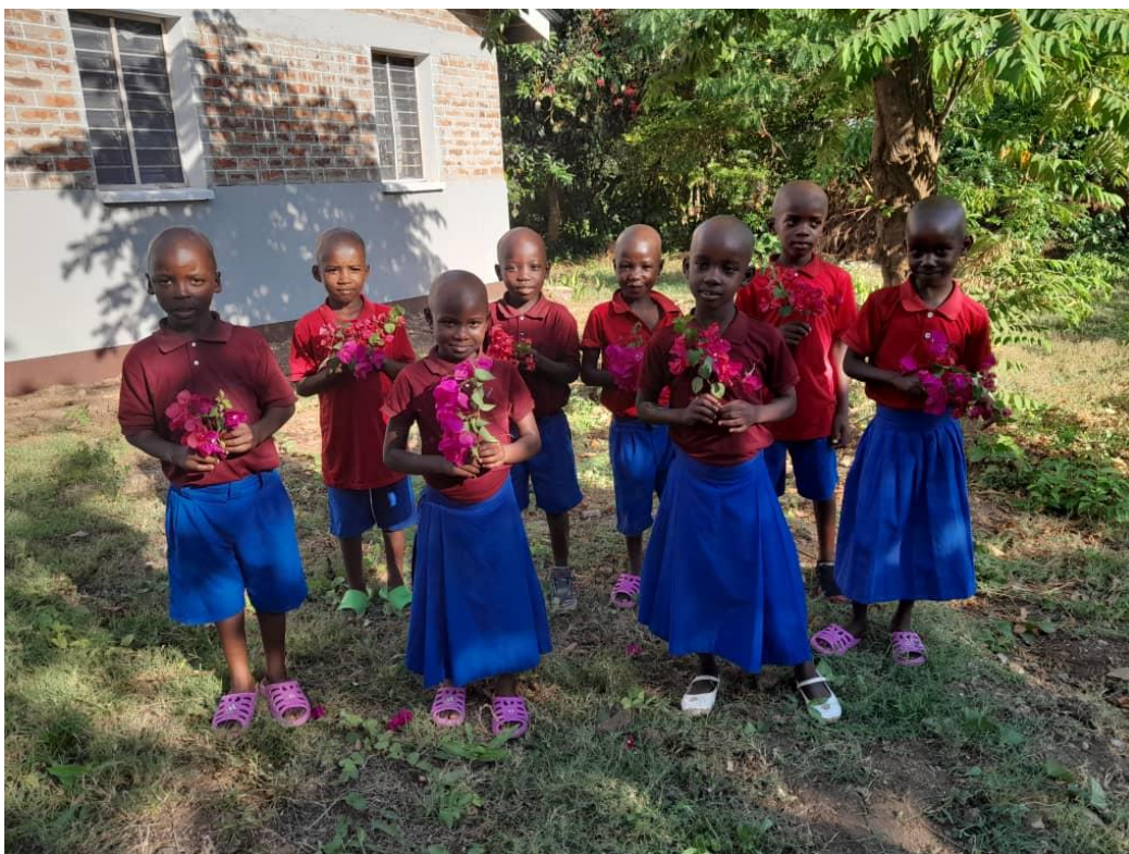
Abschlussdiplom im Kindergarten