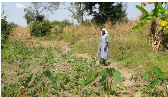
Spinat, Zwiebeln, Knoblauch