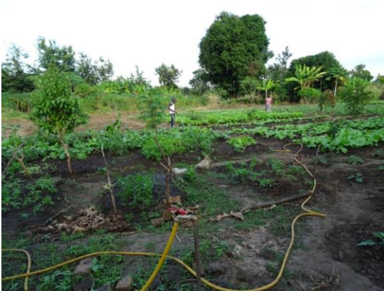
Arbeit im Gemüsegarten