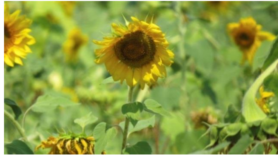
Huile de tournesol