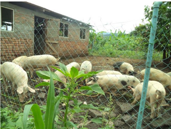
Chance dans les écuries d'animaux (ex. porcherie).