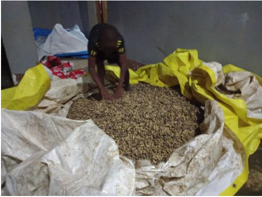
Récolte d'arachides à Mbingu