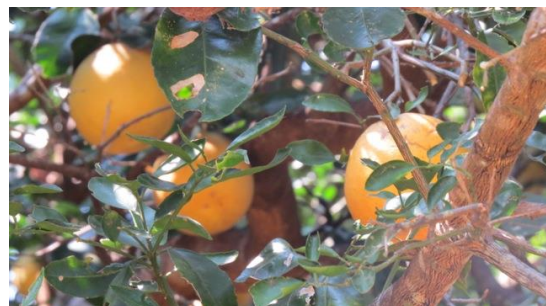
Oranges, pamplemousse, citrons gingembre