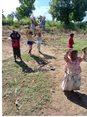
Un surplus de nature dans l'étang à poissons au profit des enfants de Mbingu.