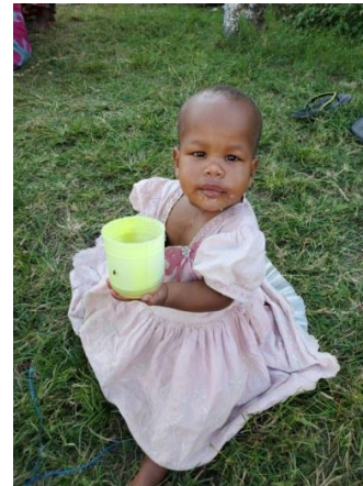
Six enfants ont été baptisés à Mbingu lors des fêtes de Noël