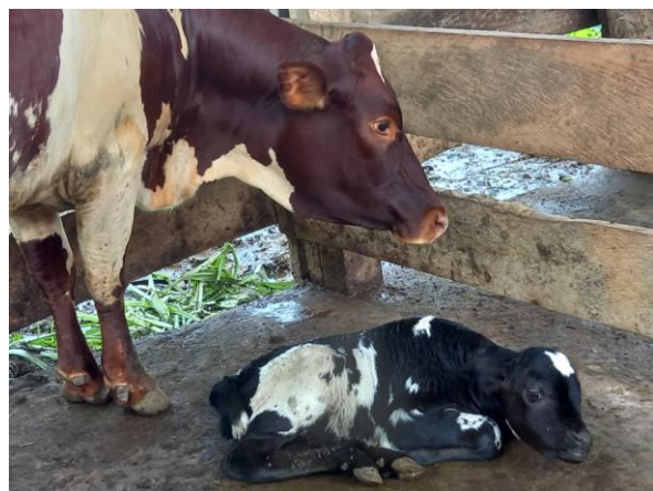
Vache fière avec un veau nouveau-né